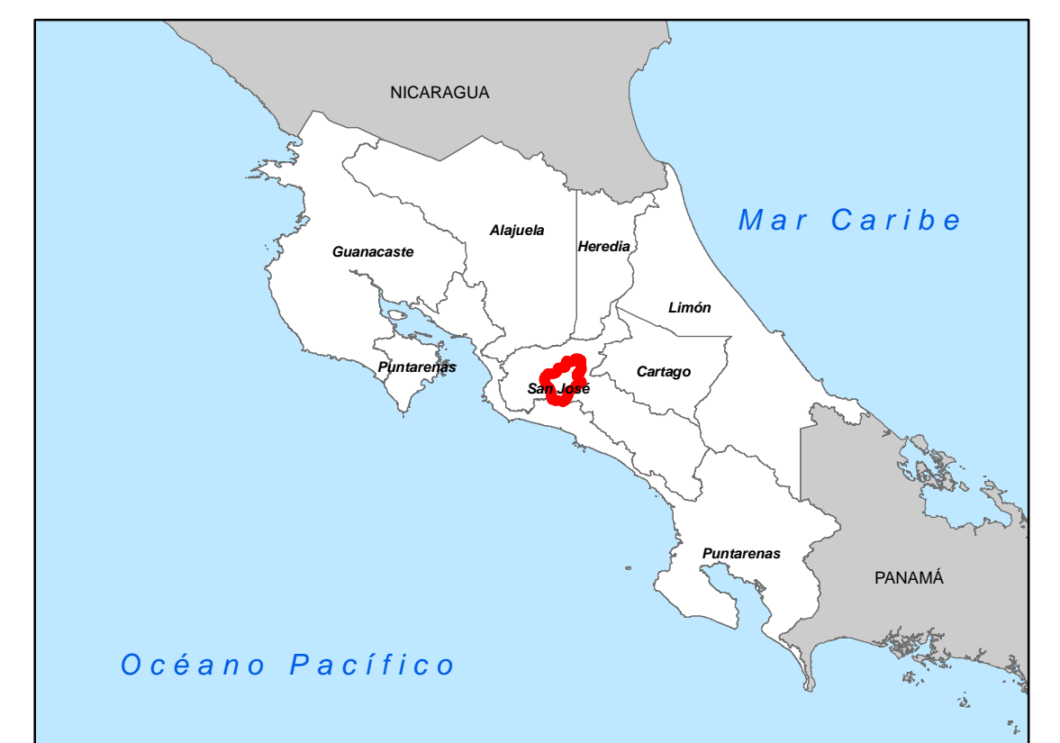
MATRIZ DE VALORES DE TERRENOS AGROPECUARIOS PROVINCIA 1 SAN JOSÉ CANTÓN 12 ACOSTA