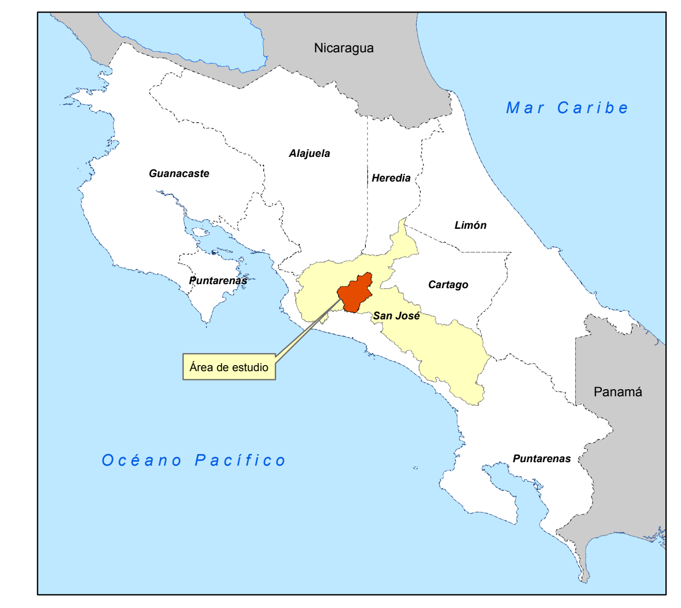
Diagrama de Ubicación