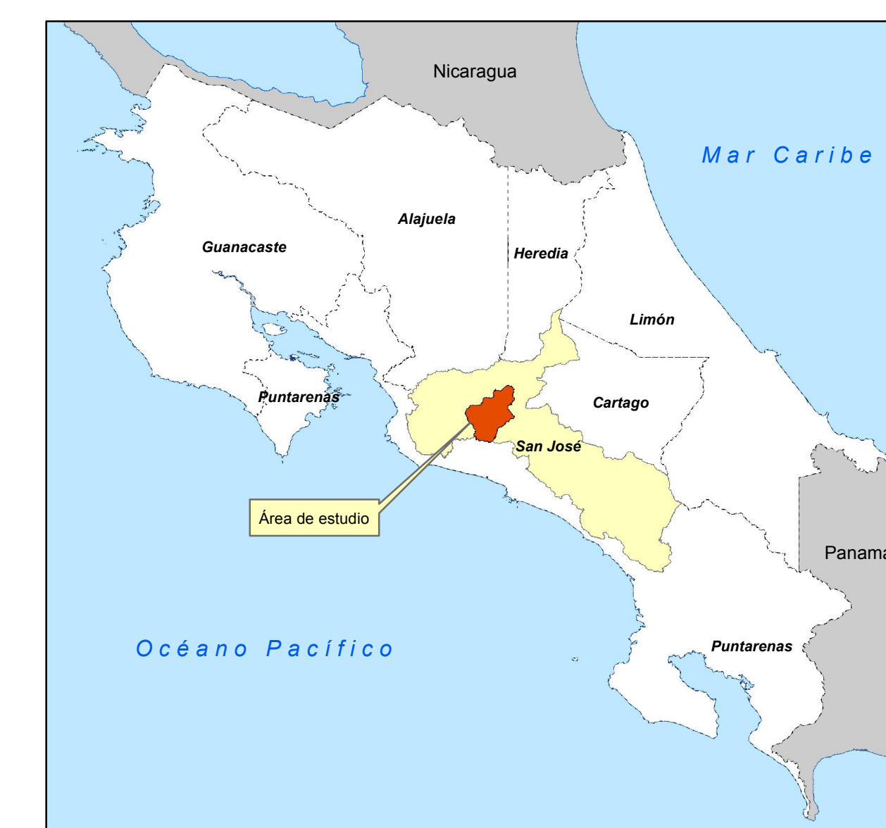
Diagrama de Ubicación