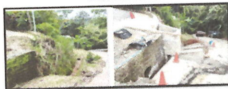
BAJOS DE JOSCO